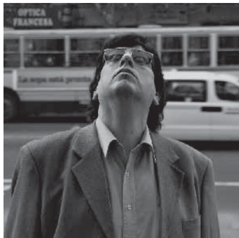
LA VIDA ÚTIL (Federico Veiroj, 2010)